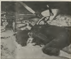
Esceunan manera esaki por mira na Vietnam, na unda e comunistanan ta tensiendo un campana di terrorismo. E bomber aki ta drumi morto banda di su bicicleta na Saigon, despues cu el a uorde mata cu piedra nan cu a hula na momento c'un bom comunista a explota.

Informacionnan autoriza ta si-gura cu e guerillerosnan norteamericano na Vietnam ta kere cu e situacion t'asina grave cu e